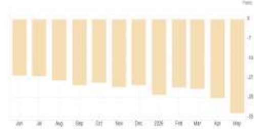
Almanya – GfK Tüketici Güven Endeksi

Almanya’da dün Mayıs ayına ilişkin GfK Tüketici Güven Endeksi (Tüketici İklimi) açıklandı. Endeks -33,3 seviyesine gerileyerek Nisan ayındaki -28,1’den belirgin şekilde düştü ve piyasa beklentisi olan -29,5 ile -30 bandının altında kaldı. Bu, son dönemde görülen en düşük seviyelerden biri olarak dikkat çekti.