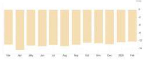
Euro Bölgesi – Tüketici Güveni

Yurt içinde bugün Ocak ayına ilişkin dış ticaret dengesi verisi açıklanacak. Aralık ayında dış ticaret açığı 9,3 milyar dolar olarak gerçekleşmişti. Piyasa beklentisi, Ocak ayında açığın 8,4 milyar dolar seviyesinde oluşması yönünde. Beklentiler, dış ticaret açığında sınırlı bir daralmaya işaret ediyor. İç talepteki dengelenme ithalatı sınırlayarak açığı aşağı çekebilirken, küresel talep koşulları ihracat performansı üzerinde belirleyici olmaya devam ediyor. Verinin beklentilere paralel gelmesi, dış dengede yılın başında kademeli bir iyileşme eğiliminin sürdüğünü gösterecektir.