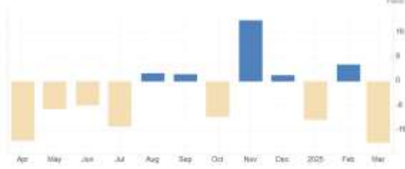
ABD – New York Fed İmalat Endeksi (Mar)