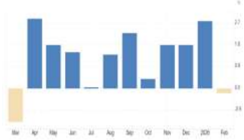
Türkiye – Perakende Satışlar

Yurtiçinde bugün Mart ayına ilişkin Perakende Satış verileri takip edilecek. Son verilerde perakende satışlar Şubat ayında yıllık bazda %15,6 artış gösterirken, aylık bazda ise %0,2 gerilemişti. Yıllık tarafta özellikle gıda dışı tüketim kalemlerinde büyümenin devam ettiği görülürken, aylık verideki sınırlı geri çekilme yüksek faiz ortamı ve finansal koşullardaki sıkılığın tüketim üzerindeki etkilerine işaret etmişti. Dayanıklı tüketim ve elektronik ürünler gibi faiz hassasiyeti yüksek kalemlerde yavaşlama dikkat çekerken, temel tüketim tarafındaki görece direnç korunuyor. Açıklanacak yeni veriler, iç talepteki momentumun devam edip etmediği ve ekonomik aktivitenin seyri açısından piyasalar tarafından önemli bir gösterge olarak izlenecek.