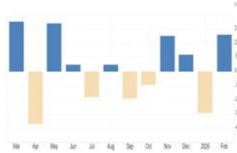
Türkiye – Sanayi Üretimi